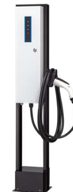
日東工業(株)製：普通充電器 (6 KW) EVPT-2G60J-F-L5